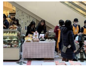
1/31 バレンタインスイーツ