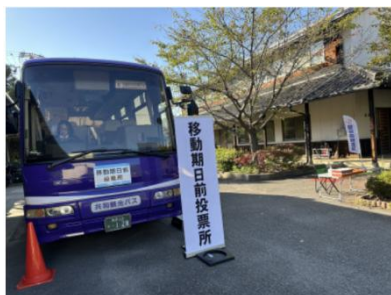
主権者教育プロジェクト