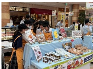
9/6 デパートゆにっと