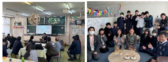
地域連携協働室オープン

生徒の探究的な学びを広く地域と繋げるために開設されました。来年度はさらに活動を広げていきますので、保護者の方からもよい企画がありましたらお寄せください。