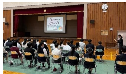
保健協議会 講演会