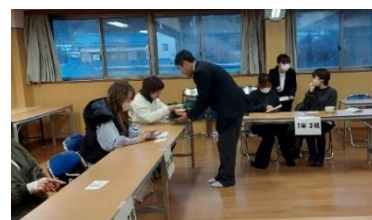
理事会終了後に茶道部よりお抹茶で慰労