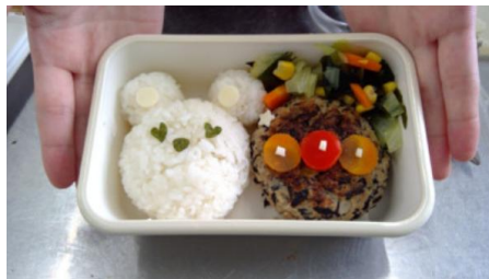
幼児のお弁当作り