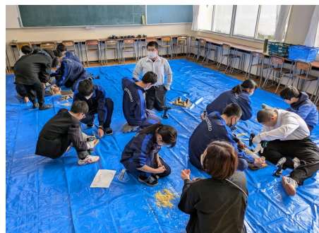
ペアになって作っていきました！