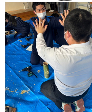
作り終わって ハイタッチしてるペアも