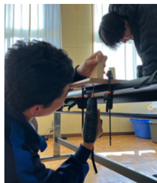
固定台から作りました！