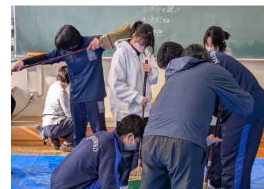
終わった後は一緒に掃除をしました！