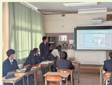
全学年合同発表会