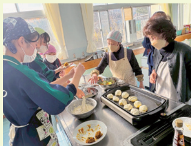
地域の方とおやき作り(3年)

1月下旬に1年間の取り組みの成果を報告する発表会が開かれ、地域の方をアドバイザーとして参加していただいています。