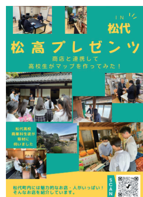
松高プレゼンツ（チラシ）

【課題研究での取り組みはこちら】 松高プレゼンツ、商店街のマップを作ってみました！